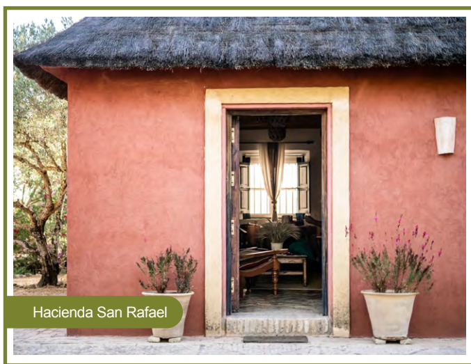
Hacienda San Rafael

Naši redaktori sa podelili o svoje obľúbené miesta na pobyt. Vyberali sme to najlepšie podľa nás zo štyroch kontinentov. Považujte tento seriál za odpoveď na otázku, ktorú naši redaktori dostávajú častejšie ako akúkoľvek inú: Aké sú vaše obľúbené hotely na dovolenku? Táto kolekcia 75 rezortov a hotelov predstavuje stovky hodín cestovania, prieskumu a vášnivých diskusií. Okrem toho však odráža aj našu trvalú lásku k miestam, kde žijeme a ktoré sú často našimi vstupnými bránami do nových destinácií. Zároveň so smútkom v hlase musíme priznať aj holú skutočnosť, že slovenské hotely sú veľmi obtiažne prístupné na akékoľvek spolupráce pre slovenského čitateľa. Veríme, že sa to časom zmení a budeme môcť zaradiť do tohto prehľadu aj slovenské hotely.