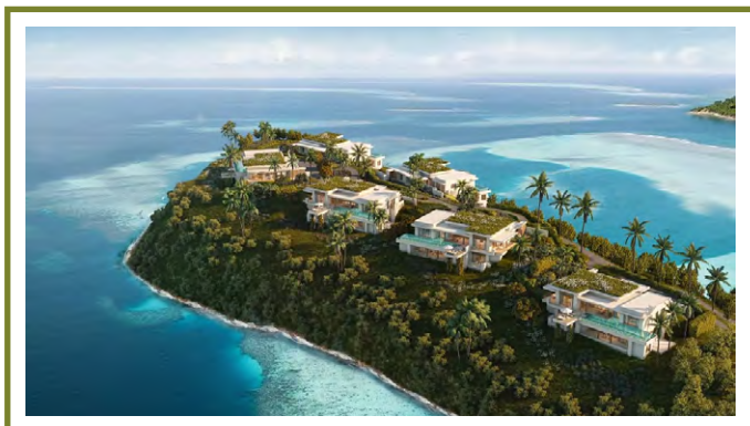
SIX SENSES LA SAGESSE GRENADA

Hotel Six Senses La Sagesse, ktorý debutuje v Karibiku na Grenade, sa rozprestiera na ploche 28 hektárov a jeho prioritou je priestor, súkromie a úchvatný výhľad na more. Rezort ponúka 56 izieb, jednoizbové vily a dvojizbové vily, ktoré sú dokonale integrované do prírodnej krajiny. Dizajn, ktorý čerpá inšpiráciu z tradičnej karibskej architektúry, odráža živú dedinu s chodníkmi vytvorenými z použitých muškátových orechov a kakaových šupiek, čím vzdáva hold dedičstvu Grenady ako „ostrova korenia“. Zážitkové centrum slúži ako centrum komunity, zatiaľ čo Great House ponúka rozmanité kulinárske zážitky vrátane reštaurácie Signature s miestnym menu inšpirovaným kreolským štýlom. Kúpele Six Senses Spa s výhľadom na lagúnu dodávajú tomuto karibskému útočisku nádych pokoja. ■