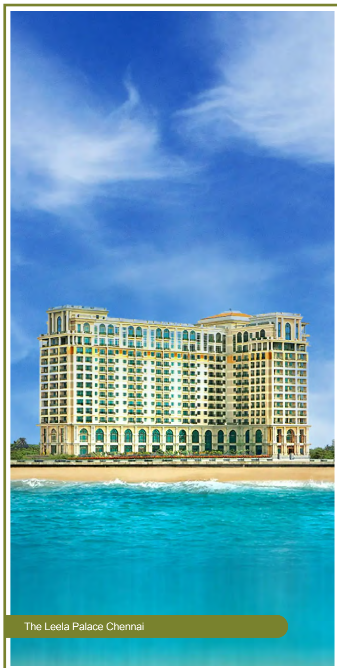
The Leela Palace Chennai