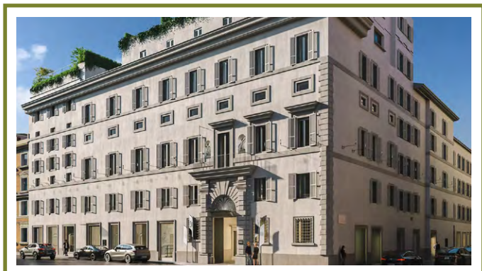
ROMEO ROMA RÍM, TALIANSKO

Všetky zariadenia Ritz-Carlton Reserve sú navrhnuté tak, aby ponúkali súkromné, prevratné cestovateľské zážitky zamerané na ľudský kontakt a spojenie miestnej kultúry, dedičstva a životného prostredia. Rezort Nujuma sa riadi touto šablónou. Je to luxusná destinácia so 63 jedno- až štvorizbovými vodnými a plážovými vilkami a celým radom luxusných zariadení a služieb. K dispozícii sú kúpele, viaceré kulinárske prevádzky, bazény, maloobchodná zóna a centrum ochrany prírody. Nujuma zaberá vyhladávané miesto na malom súostroví v Červenom mori v Saudskej Arábii a predstavuje jednoduchú voľbu pre cestovateľov, ktorí hľadajú osobitý a luxusný únik v elegantnom, uvoľnenom a intimnom prostredí. ■