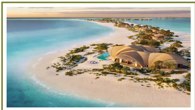
NUJUMA, A RITZ-CARLTON RESERVE SAUDSKÁ ARÁBIA

Nový rezort Four Seasons Resort and Residences, ktorý sa nachádza na úžasnom polostrove Baja California v Mexiku, sa môže pochváliť 96 apartmánmi vrátane rezidencií, vil a nehnuteľností, ktoré sa nachádzajú v exkluzívnej komunite The Cove Club na pláži Cabo Del Sol. Rezort sa rozprestiera na ploche viac ako 50 akrov pri oceáne a ponúka celý rad možností stravovania, program Kids for All Seasons a súkromný plážový klub. Hostia sa môžu zregenerovať v charakteristických kúpeľoch Four Seasons a v najmodernejšom fitnesscentre. Súčasťou Cove Clubu je aj plážový klub len pre členov s reštauráciou, plážami na kúpanie, fitnesscentrom na pláži, bazénom v štýle rezortu a súkromným golfovým klubom na najlepšie hodnotenom golfovom ihrisku v regióne. ■