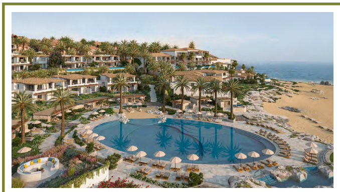
FOUR SEASONS CABO SAN LUCAS CABO DEL SOL, MEXIKO

Hotel Six Senses La Sagesse, ktorý debutuje v Karibiku na Grenade, sa rozprestiera na ploche 28 hektárov a jeho prioritou je priestor, súkromie a úchvatný výhľad na more. Rezort ponúka 56 izieb, jednoizbové vily a dvojizbové vily, ktoré sú dokonale integrované do prírodnej krajiny. Dizajn, ktorý čerpá inšpiráciu z tradičnej karibskej architektúry, odráža živú dedinu s chodníkmi vytvorenými z použitých muškátových orechov a kakaových šupiek, čím vzdáva hold dedičstvu Grenady ako „ostrova korenia“. Zážitkové centrum slúži ako centrum komunity, zatiaľ čo Great House ponúka rozmanité kulinárske zážitky vrátane reštaurácie Signature s miestnym menu inšpirovaným kreolským štýlom. Kúpele Six Senses Spa s výhľadom na lagúnu dodávajú tomuto karibskému útočisku nádych pokoja. ■